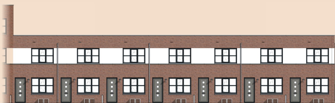
Bnr. 29 Bnr. 30 Bnr. 31 Bnr. 32 Bnr. 33 Bnr. 34 Bnr. 35