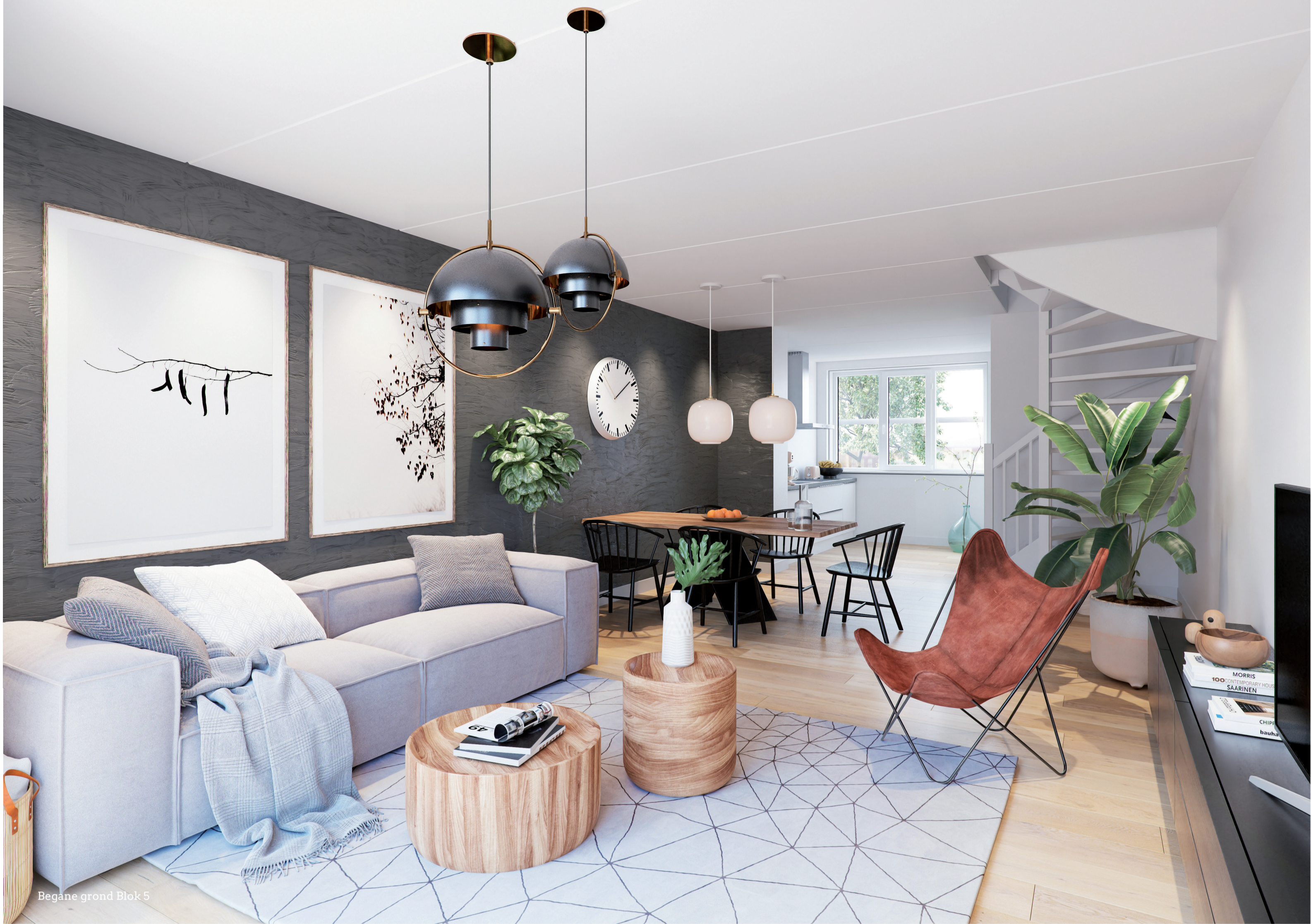
Begane grond Blok 5